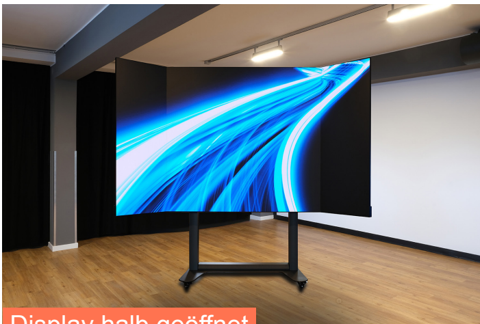
Display halb geöffnet

Klappbares, hochauflösendes LED-Display mit Lifter und intelligenter Transportlösung