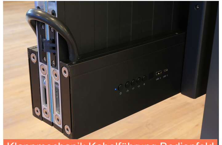
Klappmechanik Kabelführung Bedienfeld