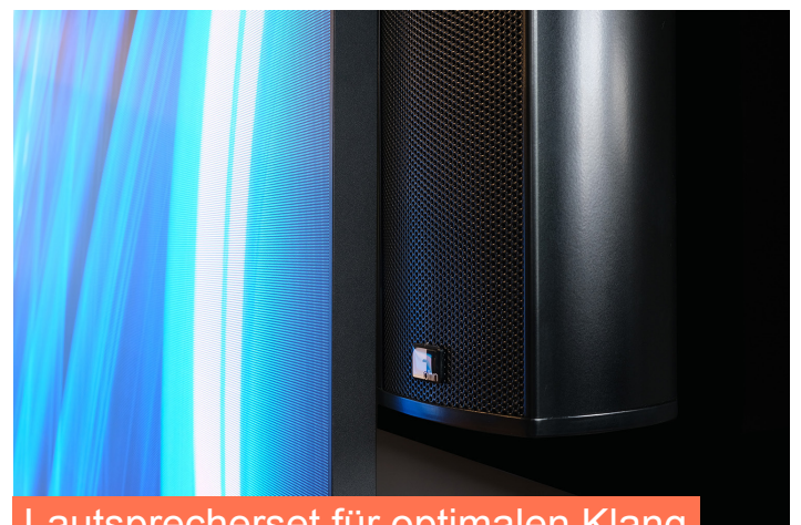
Lautsprecherset für optimalen Klang

Irrtümer, technische oder sonstige Änderungen sowie Verfügbarkeit der Produkte sind ausdrücklich vorbehalten.